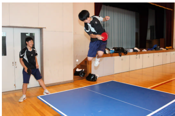
すばらしいジャンプ！