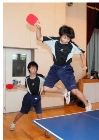
ジャンピングスマッシュ