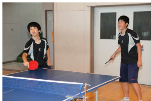
楽しみながらも大会に向けて練習